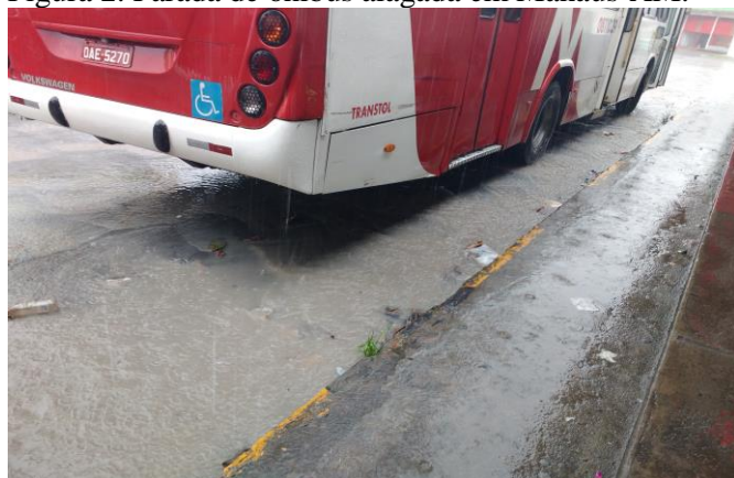
Figura 2. Parada de ônibus alagada em Manaus-AM.

Conforme o projeto, cada ponto de ônibus sustentável geraria 25kW de energia elétrica por mês, a mais do que consumiria, através dos painéis fotovoltaicos. A implantação em larga escala do modelo desenvolvido (Tabela 3), injetaria na rede de energia elétrica da cidade 32475kW por mês e considerando a taxa de energia elétrica em Manaus, no mês de janeiro de 2017, de R$0,5183, sem impostos, geraria uma economia aos cofres públicos com iluminação das paradas de aproximadamente R$150.000,00 por mês.