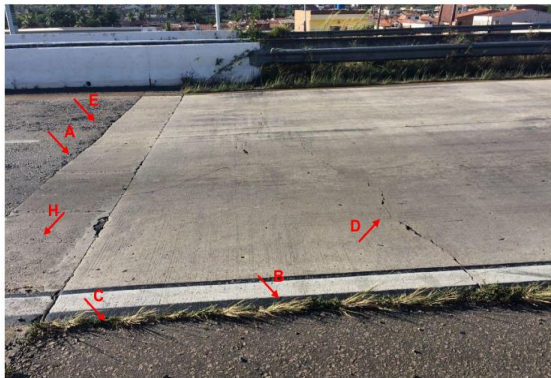
Figura 1. Manifestações Patológicas no Km 99,5 (Trecho 12).