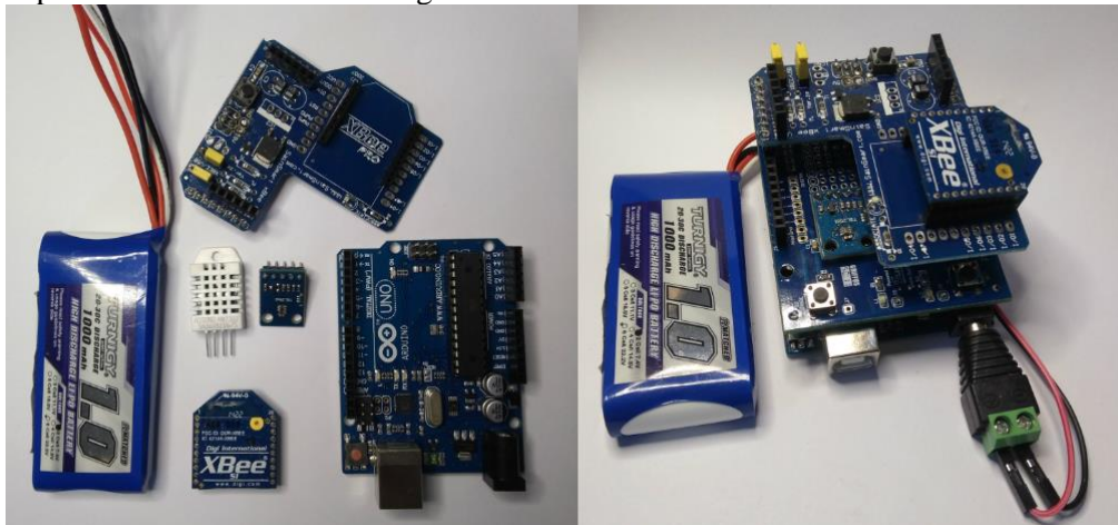
Figura 2. Componentes utilizados na montagem do nó End Device.

O módulo Xbee S1, assim como o micro controlador ATMEGA328P nas placas Arduino, é nosso grande aliado quando tratamos conceitos de eficiência energética e otimização do uso da bateria. Ambos apresentam modos Sleep de funcionamento, que colocam os núcleos de processamento e periféricos para “dormir”, reduzindo então drasticamente o consumo de corrente da bateria. Ambos os dispositivos precisam que algo os “acordem”, e eles possuem diversas maneiras para isso.