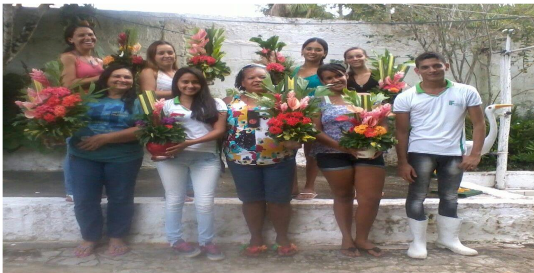
Figura 1. Resultado da fase prática do projeto: beneficiamento da flor na confecção de arranjos florais.