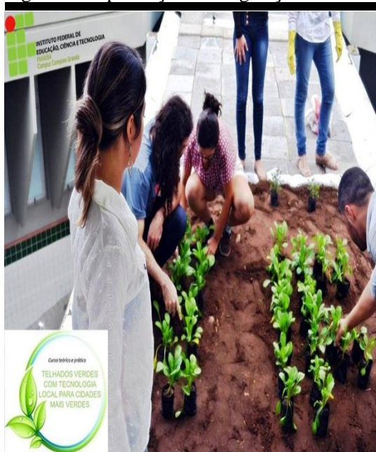
Figura 6. Implantação da Vegetação