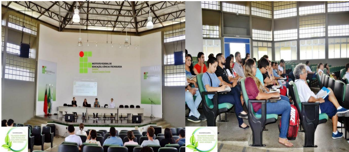
Figura 1. Imagens do Curso Teórico sobre Telhado verde

No desenvolvimento de nossas ações adotamos uma metodologia que buscou aliar teoria e prática, por meio da oferta de cursos e palestras para alunos. Foram ofertadas cerca de 50 vagas, em carácter inicial. Assim essa formação ocorreu com a capacitação dos 50 jovens, por meio da realização de uma formação complementar a vida acadêmica dos jovens, a exposição dos conteúdos ministrados adotou a metodologia teórico vivencial, por meio de aulas expositivas e dialogadas. O aprofundamento teórico se deu por meio de atividade de caráter didático-pedagógico, como: leituras, debates, palestras, exibição de documentários, entre outros. As atividades práticas abrangeram a realização da implantação do telhado verde, planejada e executada pela equipe multidisciplinar de professores do IFPB – CG e pesquisadores da UFPB.