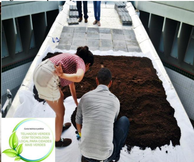
Figura 5. Implantação do telhado verde