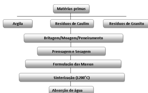
Figura 1. Distribuição espacial dos postos pluviométricos da área de estudo.

O fluxograma mostra detalhadamente o esquema de procedimento experimental para a fabricação do porcelanato através da utilização de resíduos de caulim e granito, além da argila.