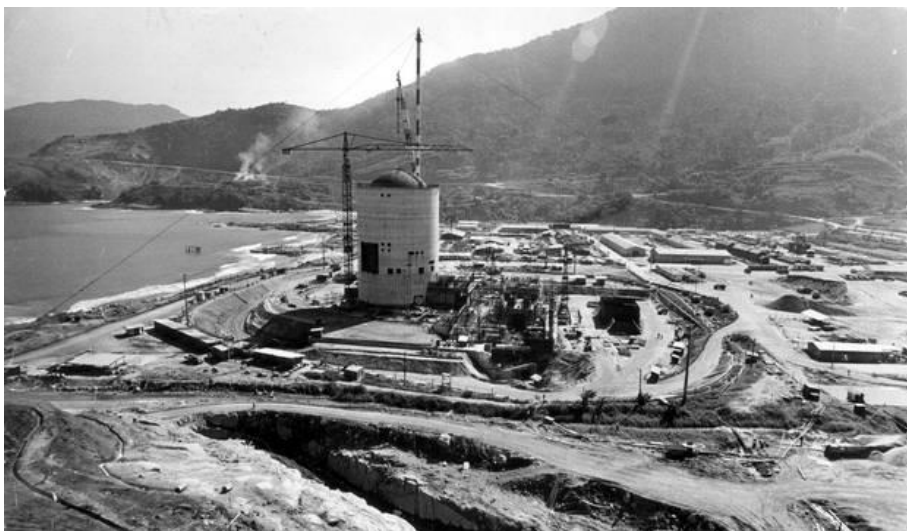
Figura 1.5. Vista geral das obras da usina nuclear Angra I, destaque para o edifício do reator, 1975.

No final da década de 1980, em 1987, foi criado o curso de pós-graduação em Engenharia de Petróleo da Universidade Estadual de Campinas (Unicamp) em 1987, resultado do convênio de cooperação científica firmado entre a Petrobras e a Unicamp, devido à necessidade de formação de profissionais especializados nas áreas de exploração e produção de óleo e gás, atendendo à demanda nacional e internacional de recursos humanos na indústria do petróleo. Esses esforços para formação de profissionais na área de Petróleo culminaram com a criação do curso de Engenharia de Petróleo da Universidade Estadual do Norte Fluminense (UENF), em 1994.