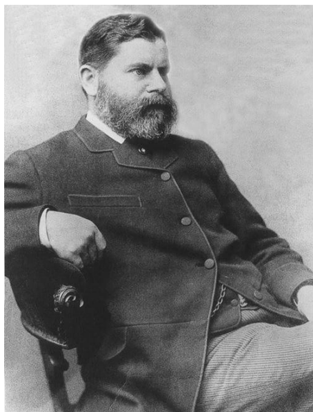
Figura 1.1. George Edward Davis (1850–1906), o primeiro a difundir a necessidade do surgimento de uma nova profissão ligada à indústria química e a formalizar o ensino desta nova profissão em um conjunto de doze aulas ministradas na Manchester Technical School .

O modesto modelo de formação empreendido por George Davis, que à época não foi bem aceito pela comunidade acadêmica e pelos engenheiros, ressurgiu oito anos depois, 1888, no MIT ( Massachusetts Institute of Technology ), nos EUA, como o primeiro curso de Engenharia Química independente dos restantes ramos da Engenharia, formado sua primeira turma em 1891, com sete engenheiros químicos pioneiros. 3