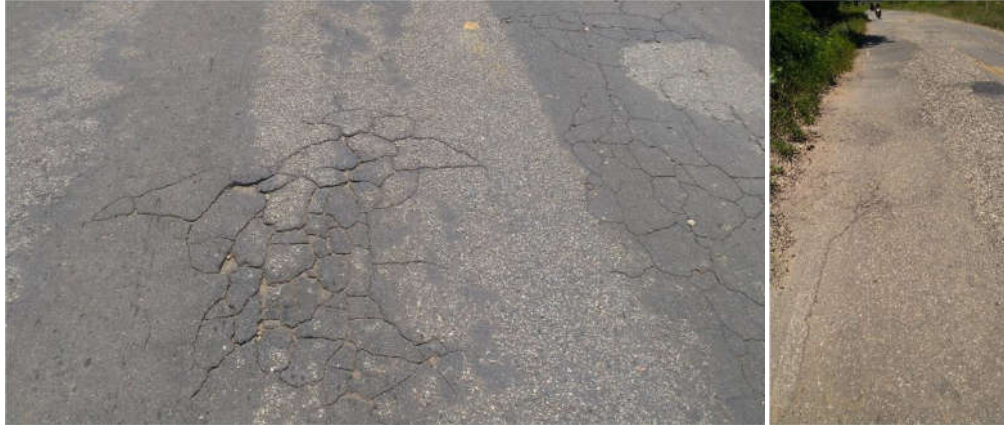
Figura 2. Trincas tipo couro-de-jacaré (esquerda) e trinca longitudinal (direita) encontradas na SE-065

Trincas e Fissuras - Ao longo do trecho analisado neste estudo foram observados trincas longitudinais, transversais e em couro-de-jacaré conforme Figura 02, variando apenas sua severidade.