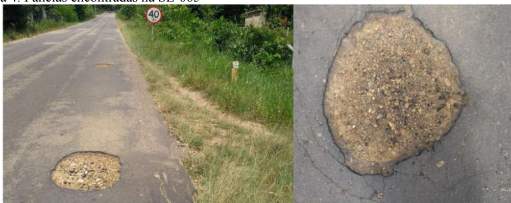
Figura 4. Panelas encontradas na SE-065

Panelas - Panelas, ou como são conhecidas popularmente, buracos, são cavidades que ocorrem na superfície do pavimento podendo chegar as camadas inferiores da estrutura, sendo consequência de um processo avançado de degradação do pavimento, podendo afetar a capacidade estrutural do mesmo; e em casos mais graves são acompanhadas por erosão interna (SCHMIDT, 2016).