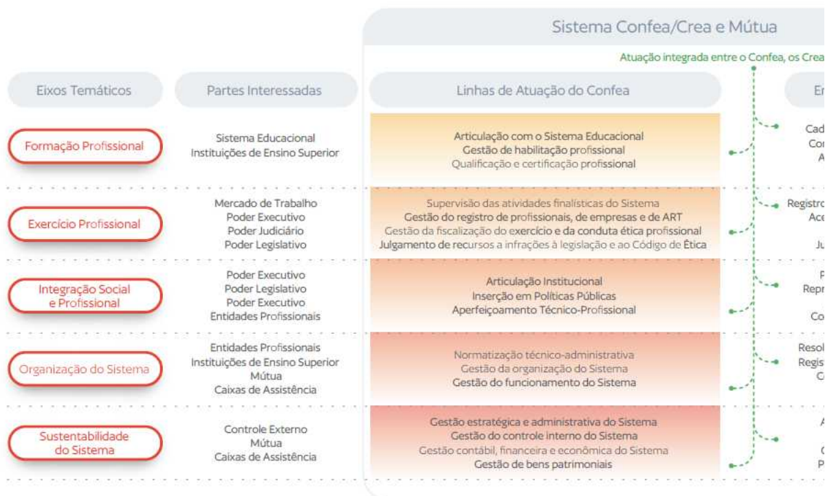
Figura 1 - Modelo de Negócio Sistema Confea/Crea e Mútua 2022

Nesse contexto, o modelo de negócio do Confea consiste na forma como se cria, entrega e captura valor, de modo que a entrega do valor público do Confea deve seguir pela atuação sistêmica, isto é, integrando os 27 Creas e a Mútua. A figura a seguir demonstra os eixos temáticos que guiam a atuação do Sistema, as partes interessadas (ou stakeholders) e os macroprocessos do Confea, os quais interdependem da atuação dos Creas para gerar as entregas do Sistema para cada tipo de cliente: