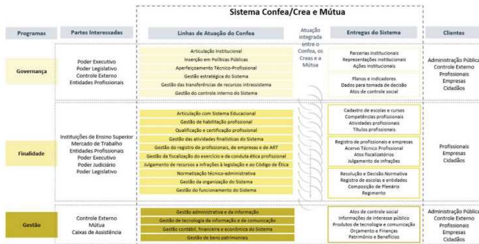
Figura 1. Modelo de Negócio Sistema Confea/Crea e Mútua 2023

Nesse contexto, o modelo de negócio do Confea consiste na forma como se cria, entrega e captura valor, de modo que a entrega do valor público do Confea deve seguir pela atuação sistêmica, isto é, integrando os 27 Creas e a Mútua. A figura a seguir apresenta os programas que conduzem a atuação do Sistema, as partes interessadas (ou stakeholders) e as linhas de atuação do Confea, os quais interdependem da atuação dos Creas para gerar as entregas do Sistema para cada tipo de cliente.