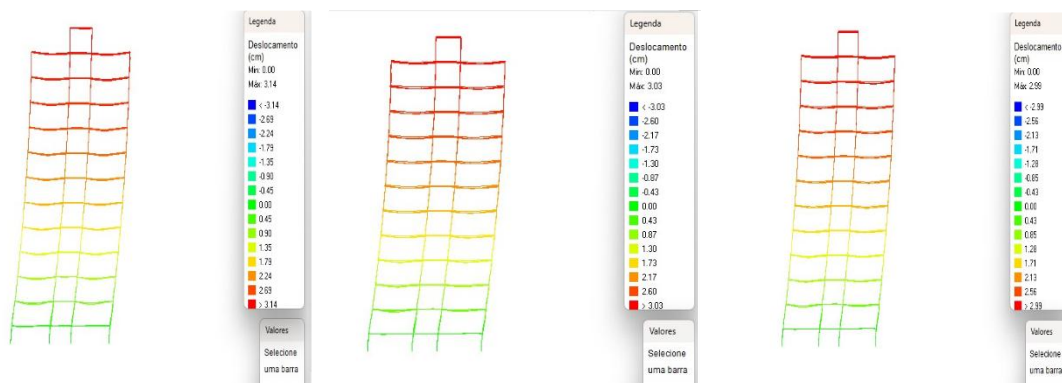
Figura 03: Pórticos do edifício de 10 pavimentos – A: Laje maciça; B: Laje treliçada; C: Laje nervurada.

Com o aumento para 10 pavimentos, os efeitos estruturais se intensificam, especialmente no que diz respeito aos deslocamentos horizontais e à instabilidade global. A laje nervurada obteve o menor deslocamento (2,91 cm), seguida pela treliçada (2,92 cm) e, por fim, a maciça (2,99 cm). Quanto ao \gamma_z , todos os sistemas ultrapassaram o limite de 1,10, evidenciando a necessidade da consideração dos efeitos de segunda ordem. A laje treliçada teve o menor valor (1,20), seguida pela nervurada (1,21) e maciça (1,25), novamente sendo a menos recomendada.