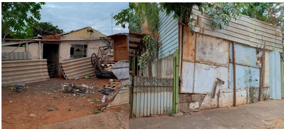
Figura 1. Moradias improvisadas com tapumes e chapas metálicas.

Na Figura 1, observa-se a realidade enfrentada por muitas famílias em situação de vulnerabilidade, que vivem em moradias improvisadas feitas com tapumes metálicos e madeira reaproveitada. Essa condição precária evidencia a urgência de soluções habitacionais mais dignas, como o adobe, que alia sustentabilidade, conforto térmico e baixo custo.