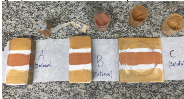
Figura 1. Aplicação da segunda demão da superfície de concreto com observância do selador (parte branca) esperando a secagem para ser colocados nos seus respectivos ambientes.

observação da intensidade das cores e resistência às condições de exposição. A Figura 1 ilustra a aplicação nas superfícies.