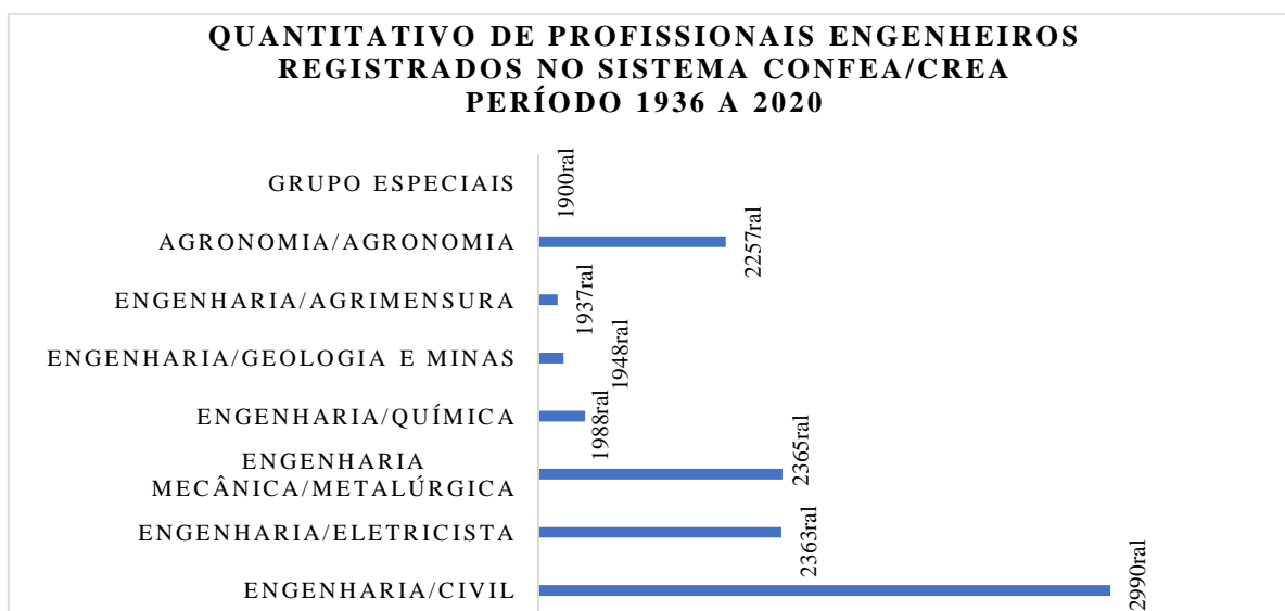
Gráfico 1 – Quantidade de profissionais – Engenheiros e Engenheiros Agrônomos registrados no Sistema Confea/Crea por Estado no período de 1936 a 2020.

No Gráfico 1 é apresentada a quantidade de profissionais – engenheiros e engenheiros agrônomos registrados no sistema Confea/Crea conforme grupo e modalidade descrita no Quadro 1. Esse quantitativo é relativo ao período de 1936 a 2020, somente de profissionais ativos. Vale ressaltar que o período final de quantificação profissional é até 01/07/2020.