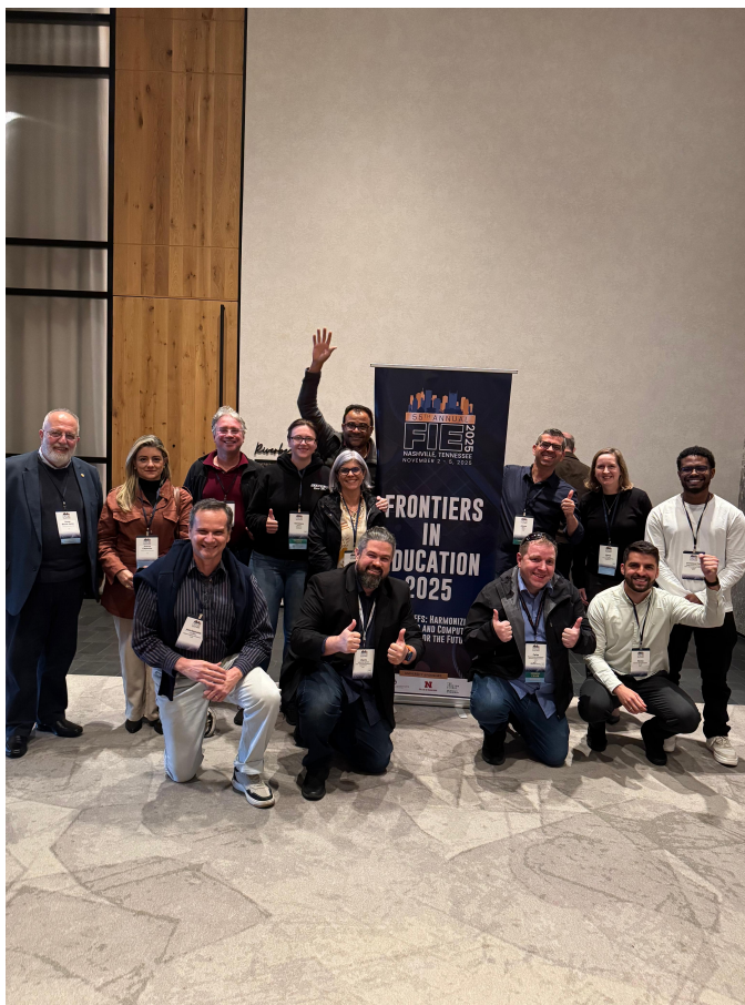
Representantes de entidades e instituições de ensino do Brasil

Desse modo, o impacto do FIE transcende a apresentação de artigos, influenciando diretamente a estruturação de cursos de engenharia e computação, a atuação docente e a formação de futuros engenheiros, fortalecendo o alinhamento às demandas atuais da sociedade e do setor tecnológico.