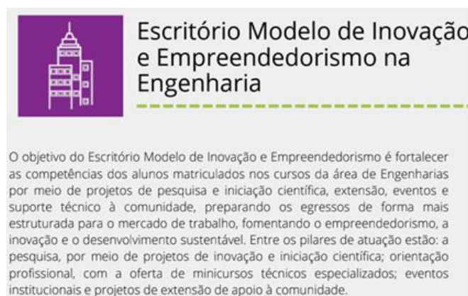
Figura 3. Escritório Modelo de Inovação e Empreendedorismo na Engenharia EMIE 2

O objetivo da Educação Empreendedora na visão do SEBRAE -RJ é o de desenvolver o comportamento e atitudes empreendedoras nos discentes e instrumentalizá-los com ferramentas que os permitam inovar e empreender de forma disciplinada e estruturada.