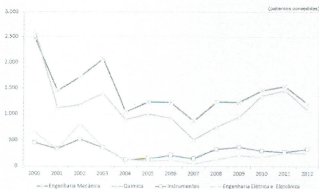
3.1.6 Patentes concedidas pelo Instituto Nacional da Propriedade Industrial (INPI), segundo setor tecnológico de acordo com a Classificação Internacional de Patentes (IPC, na sigla em inglês), 2000-2012

Fonte: Instituto Nacional da Propriedade Industrial (INPI), Assessoria de Assuntos Econômicos, Base de Dados Estatísticos de Propriedade Intelectual - BADEPI