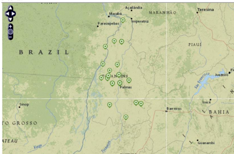
Figura 4. Rede de Multiplicadores e de URTS do Projeto ABC CORTE da Embrapa Pesca e Aquicultura.