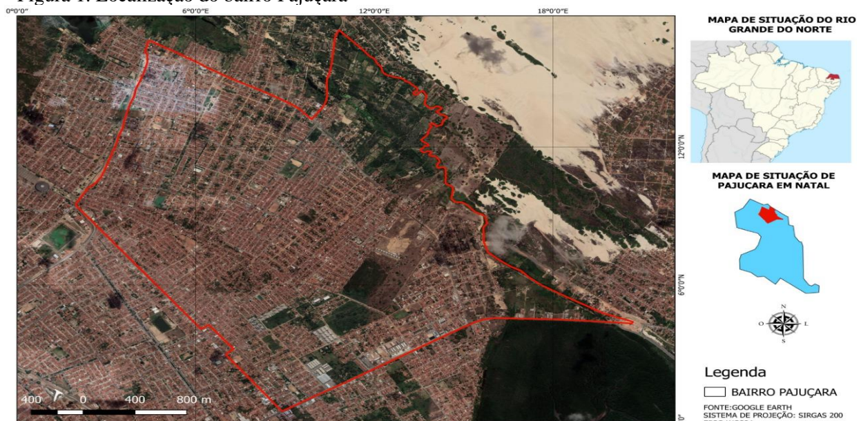
Figura 1. Localização do bairro Pajuçara